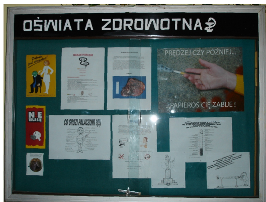
Gablota na pierwszym piętrze.

Rozdawanie ulotek uczniom, rodzicom, nauczycielom oraz pracownikom administracyjnym szkoły przez samorząd Szkolny.