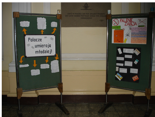
Hol przy głównym wejściu.