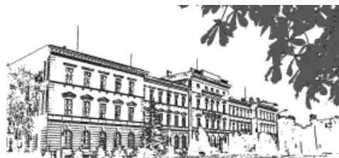
Ewa Dąbrowska, Dzieje Państwowej Szkoły Przemysłowej w Bielsku od 1874 do 1950 roku, Bielsko 2009.

Szkoła średnia daje możliwość przyswojenia sobie wiadomości dla fachowców z zakresu budownictwa, jak: murarzy, cieśli, kamieniarzy, stolarzy, blacharzy, zdunów, dekarzy itp., a także budowniczych maszyn, budowniczych młynów, mechaników i ślusarzy, którzy będą prowadzili